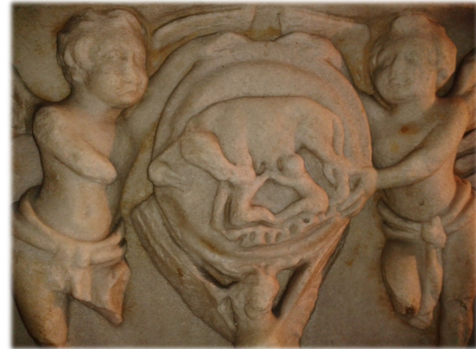
Romulus et Remus